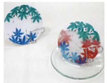
【同じ図案の絵付】 透明になると裏に描いた紅葉が現れる(右)

種々検討の結果、安定した発色と耐久性のある加飾用絵具の開発に成功し、色とりどりの絵具によって京焼・清水焼の伝統的な絵付技法を活かしながら様々な図案を生み出すことが可能となりました。