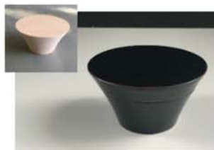
【ケミカルウッド素地(漆器)】